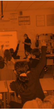
Ne pas jeter sur la voie publique • Graphisme : Effervescentre